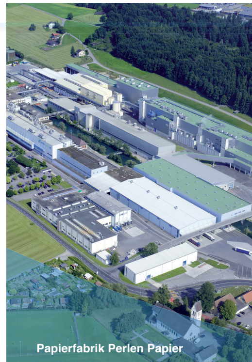
Papierfabrik Perlen Papier

HP-Produkte entsprechen den Normen von FSC®* (*Forest Stewardship Council)